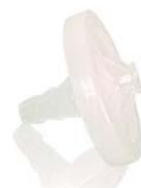
Luftfilter (Art.-Nr. 1020155)