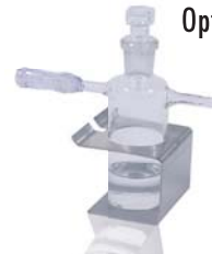
Aromaflasche + Halterung (Art.-Nr. 1011055 + 1012055)