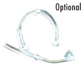
AIRNERGY Headset-Diffusor (Art.-Nr. 1007055)