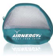
Atembrillentasche (Art.-Nr. 4017055)