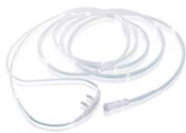
Atembrille (Art.-Nr. 1005255)