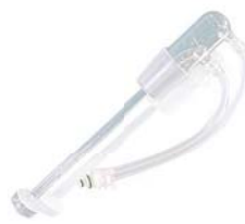
Sprudelelement (Art.-Nr. 1010455)