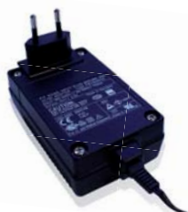
Netzteil (Art.-Nr. 1033355)